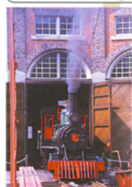
《アイアンホース号》運行ルート

アイアンホース号 北海道で最初に輸入された《義経号》《弁慶号》《しづか号》と同じアメリカのH.K.ポーター社で明治42(1909)年に製造されました。小型ですが、開拓時代に走った機関車の特徴を見ることが出来ます。アイアンホース号は客車を引いて構内の線路を実際に走ります。SL乗車をお楽しみください(乗車無料)。