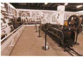
蒸気機関車資料館

小樽築港機関区でも使用されていた工具・グーヅ類と蒸気機関車の部品を展示。精密に作られた縮尺1/5の蒸気機関車もご覧いただけます。